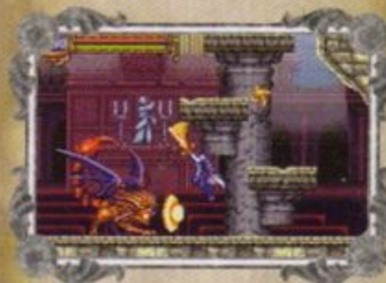
Game Boy Advance™ Screens / Game Boy Advance™ Bildschirmfotos / Ecrans Game Boy Advance™

Screen text / Bildschirmtext / Langue du jeu